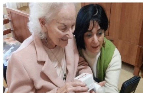
L’arrivo dei doni i “Nipoti di Babbo Natale”, presenti in tutta Italia, sono giunti anche ad Asiago

Anche quest’anno i regali per gli ospiti della casa di riposo di Asiago arrivano con i “Nipoti di Babbo Natale”, l’iniziativa nazionale che porta sorrisi e calore nei cuori degli anziani ospiti delle case di riposo. Sono stati undici residenti dell’I-pab asialgese ad esprimere dei desideri poi realizzati grazie alla generosità dei nipoti d’adozione che sono riusciti a trasmettere, pure a distanza, un gesto d’affetto rendendo ancora più magico il Natale. C’è chi sogna un nuovo taglio di capelli, chi un profumo, chi vorrebbe una tuta oppure qualcosa per passare allegramente il tempo con gommitto di lana, colori e album da disegno. Tra collane di perle e rasoi per la barba, i “Nipoti di Babbo Natale” hanno avuto l’imbarazzo della scelta e in poche ore dalla pubblicazione